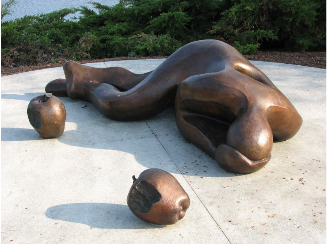
„SHAME“ (Scham, Schande) Skulptur des Sündenfalls auf dem Campus der Cedarville University, Cedarville, Ohio

Beschreibe die oben abgebildete Skulptur!